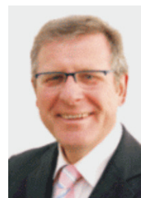
Wilfried Brandes Bürgermeister

Ich wünsche, und dabei stimme ich mit dem Rat der Gemeinde Ilsede und den Mitgliedern des Orsrates Solschen überein, dass sich immer wieder Frauen und Männer, Erwachsene und Jugendliche, finden, die die Traditionen aus einer 100jährigen Vereinsgeschichte mit neuen Ideen verbinden und damit immer wieder mit ihrem Verein und seinem Angebot die Einwohnerinnen und Einwohner ansprechen. Der SG Solschen wünsche ich in diesem Sinne eine weiterhin erfolgreiche Arbeit und alles Gute für die Zukunft.